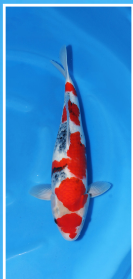
Nogami 3 van 35cm -> 56cm, female