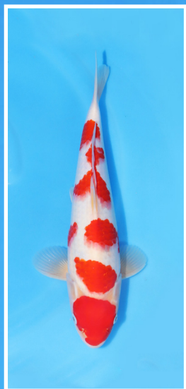
Nogami 1 van 36cm -> 56cm, female

Tot slot hebben we ook nog nieuws: volgend jaar, dus in 2023, komt Koi Wijzer terug met een splinternieuw Azukari Dream-project! De details volgen later!